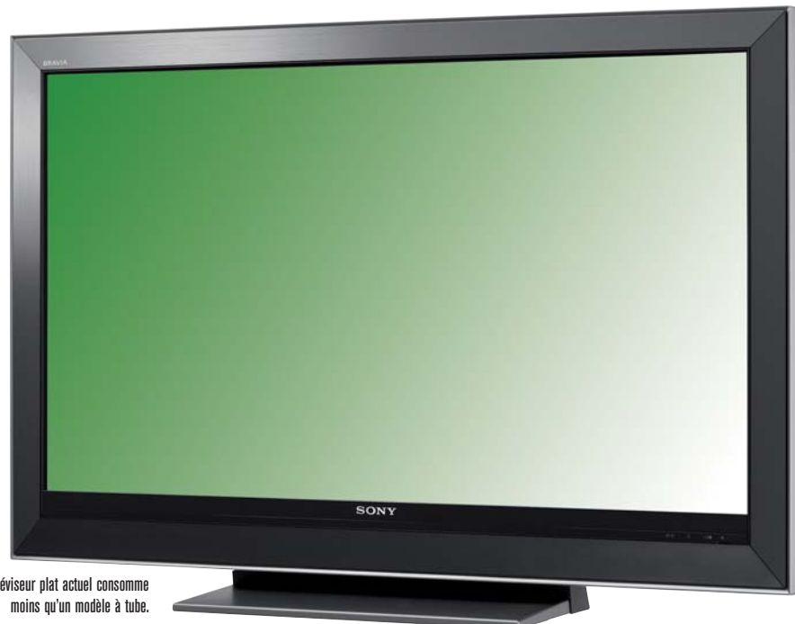
À diagonale équivalente, un téléviseur plat actuel consomme moins qu'un modèle à tube.

ne s'est pas fait attendre. Les constructeurs de LCD ont désormais implémenté un rétro-éclairage intelligent qui adapte la puissance lumineuse en fonction du contenu. Match nul, la balle au centre. En fait,